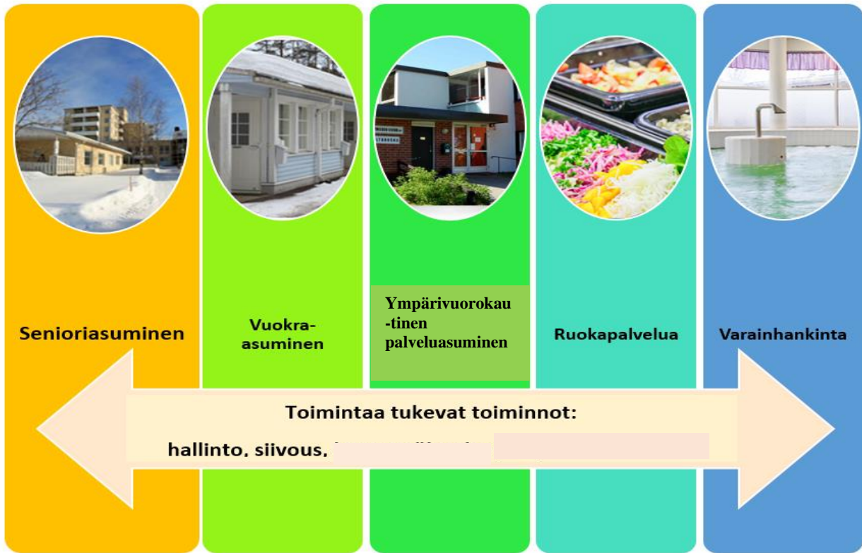
Kuvio 1. Yhdistyksen tuotetarjooma eli palveluvalikoima.